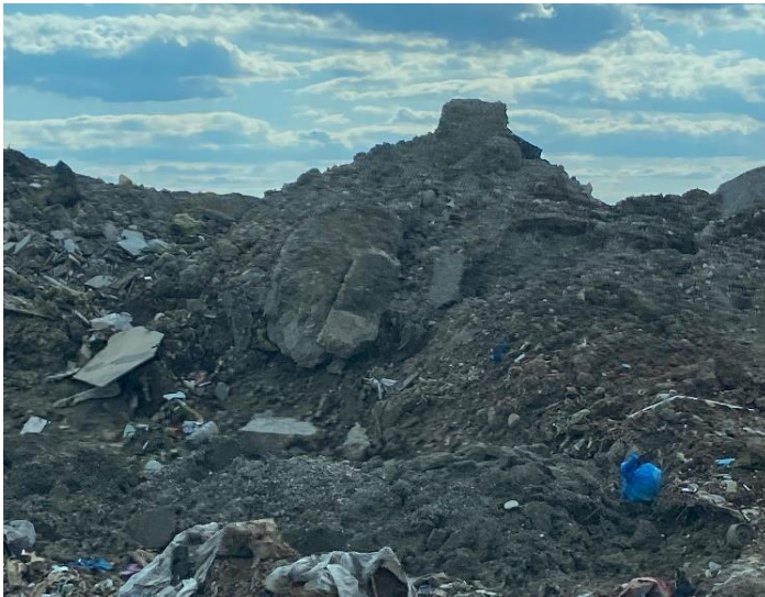
Fotoğraf 7: Moloz döküm sahasından bir görünüm. Deprem sonrası yıkıntılarla dolu bu alan hem çevre kirliliğine hem de toz taşınımına neden olmaktadır. (Azra Aslanca)

6 Şubat 2023'te meydana gelen Kahramanmaraş merkezli depremler, Adıyaman başta olmak üzere birçok ili hem fiziksel hem de çevresel açıdan derinden etkilemiştir. Depremin hemen ardından yürütülen arama-kurtarma, enkaz kaldırma ve geçici barınma faaliyetleri, çevre yönetimi açısından ciddi sorunları beraberinde getirmiştir. Müdahalelerin çoğu, plansız ve kontrolsüz bir şekilde gerçekleştirilmiş; bu durum afetin yalnızca yapıların yıkımıyla sınırlı kalmamasına, aynı zamanda uzun vadeli çevresel tahribata yol açmasına neden olmuştur.