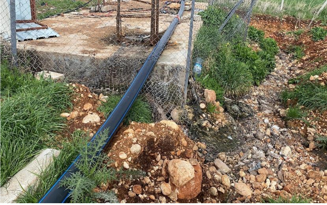
Fotoğraf 8: Konteyner kentteki su arıtım hattında oluşan boru çatlağı nedeniyle çevreye yayılan sızıntı hem hijyen hem de altyapı sorunlarını ortaya koymaktadır. (Adıyaman, Mart 2025)

Bir diğerk önemli sorun ise geçici barınma alanlarının çevresel etkileridir. Konteyner kentler ve çadır yerleşimleri çoğunlukla yeterli altyapıdan yoksun olarak kurulmuş; atık su sistemleri, katı atık yönetimi ve temiz suya erişim gibi temel hizmetler ya eksik kalmış ya da hiç sağlanamamıştır. Bu durum, özellikle sıcak mevsimlerde hijyen sorunlarını artırmış; toprak ve su kirliliğine, hatta bulaşıcı hastalıkların yayılmasına zemin hazırlamıştır (Kızılay, 2023). Aynı zamanda jeneratörler ve fosil yakıtla çalışan ısıtma araçları hem gürültü hem de hava kirliliğine katkı sunmuştur.