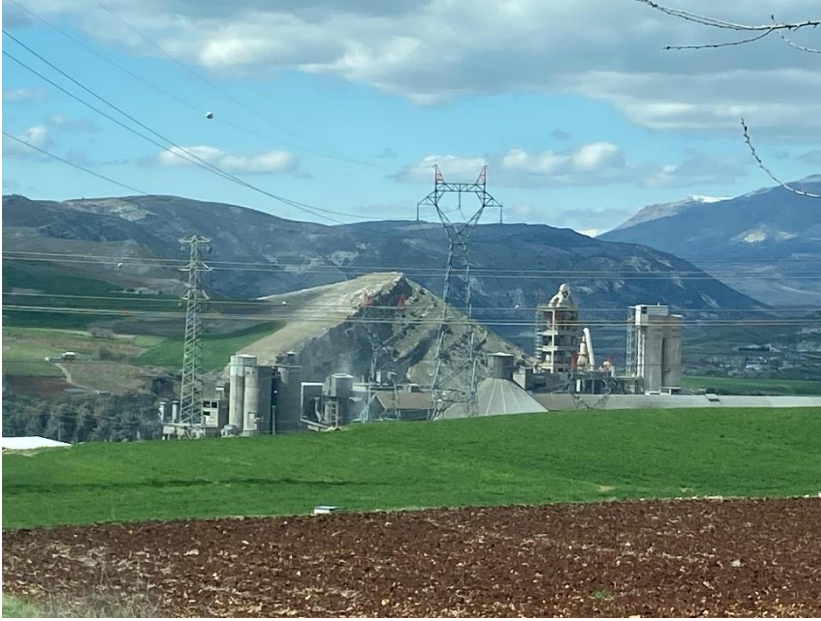
Fotoğraf 5. Adıyaman'da bulunan bir çimento fabrikasına ait genel görünüm, Mart 2025. (Azra Aslanca)

Adıyaman'ın coğrafi ve jeolojik yapısı, beton ve çimento üretimine yönelik hammadde açısından zengin bir yapıya sahiptir. Bölgede yaygın olarak bulunan kalker (kireçtaşı) rezervleri, çimento üretiminde ana girdi olan kalsiyum karbonatın kolaylıkla temin edilmesini mümkün kılmaktadır. Ayrıca Fırat havzasına yakınlığı nedeniyle taşımacılık açısından sağlanan kolaylık, hammadde tedarik zincirinde maliyet avantajı yaratmakta ve yerel sanayinin gelişimini teşvik etmektedir. Bunun yanı sıra, uzun yıllardır Adıyaman ve çevresinde gelişen inşaat sektörü ve artan konut talebi, bölgesel ölçekte beton üretim tesislerinin kurulmasını desteklemiştir (Adıyaman İl Çevre Durum Raporu, 2020). Bu doğal ve ekonomik koşullar, Adıyaman'ı yapı malzemeleri üretimi açısından cazip bir konuma taşımıştır.