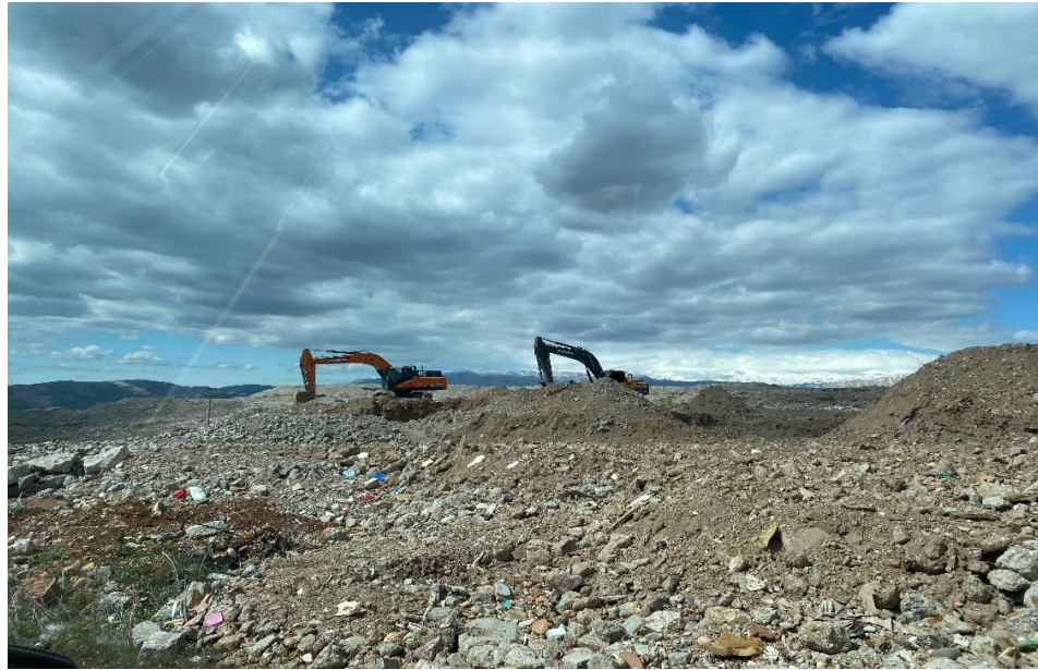
Fotoğraf 1-2. Adıyaman Şambayat Mevkii'nde 2025 yılı Mart ayında çekilmiş, moloz alanını gösteren genel görünüm. (Azra Aslanca)