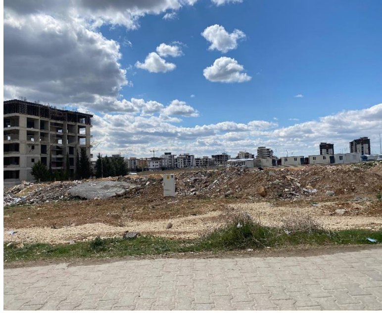
Fotoğraf 3: Yoğun yapılaşma ile deprem yıkımının yan yana geldiği Adıyaman Merkez, Mart 2025. (Azra Aslanca)

"Uzun süredir yıkımlar devam ediyor çoğunlukla önceden uyarılmıyoruz bile yıkım olacak diye... Sulanarak yıkılmayan birçok bina oldu şimdiye kadar o tozla yaşıyoruz..." (Görüşmeci 3)