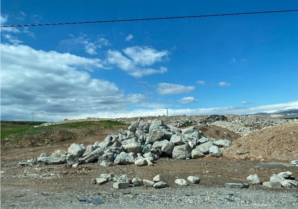
Fotoğraf 9-10: Deprem sonrası molozların kontrolsüzce biriktirildiği Adıyaman'daki bir enkaz sahası. Toz, parçalanmış yapı malzemeleri ve atıklar çevre sağlığı açısından tehdit oluşturmaktadır. (Azra Aslanca)