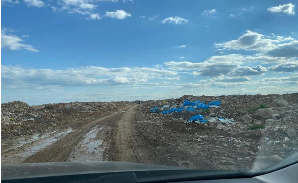
Fotoğraf 6: Adıyaman'da yer alan bir çöp döküm arazisinden genel görünüm, Haziran 2025.

Sanayi kaynaklı kirlilik açısından bakıldığında, özellikle Adıyaman Organize Sanayi Bölgesi'nde faaliyet gösteren bazı tekstil, gıda ve kimya sanayi işletmelerinin atık yönetiminde yetersizlikler yaşadığı tespit edilmiştir. Toprağa doğrudan ya da dolaylı sızan atıklar, uzun vadede arsenik, kurşun ve kadmiyum gibi toksik maddelerin birikmesine sebep olmaktadır (TÜBİTAK MAM, 2020).