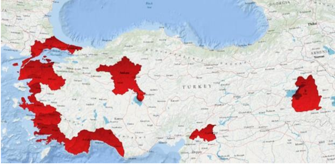
Harita 2: Çevrimiçi ankete dönüş yapan sivil toplum kuruluşlarının coğrafi dağılımı

Ayrıca ankete dönüş yapan STK'lar arasında ulusal seviyede faaliyet gösterenler (n=5) de bulunuyor (Harita 2).