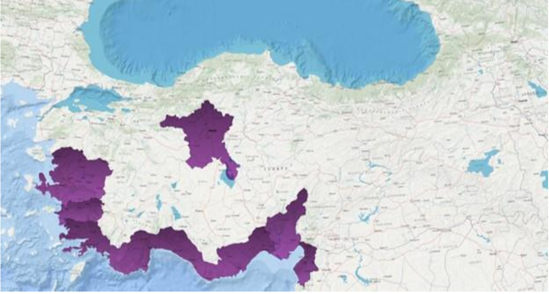
Harita 3: Çevrimiçi ankete dönüş yapan savunucu/aktivistlerin coğrafi dağılımı

Çevrimiçi ankete on sekiz aktivist/savunucu geri dönüş yaptı. Bu aktivist/savunucular Ankara (n=4), Manisa (n=1), İzmir (n=5), Aydın (n=1), Muğla (n=9), Antalya (n=1), İçel (n=1), Adana (n=1) ve Hatay (n=1) illerinde aktivizm/savunuculuk faaliyetlerinde bulduklarını bildirdiler. (Harita 3).