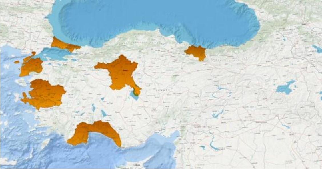
Harita 1: Çevrim içi ankete dönüş yapan serbest avukatların coğrafi dağılımı

Çevrimiçi ankete on serbest avukat dönüş yaptı. Bu avukatlar Ordu (n=1), İstanbul (n=1), Çanakkale (n=1), Ankara (n=1), Manisa (n=1), İzmir (n=4) ve Antalya (n=1) illerinde çalışmalar yürütüyor (Harita 1).